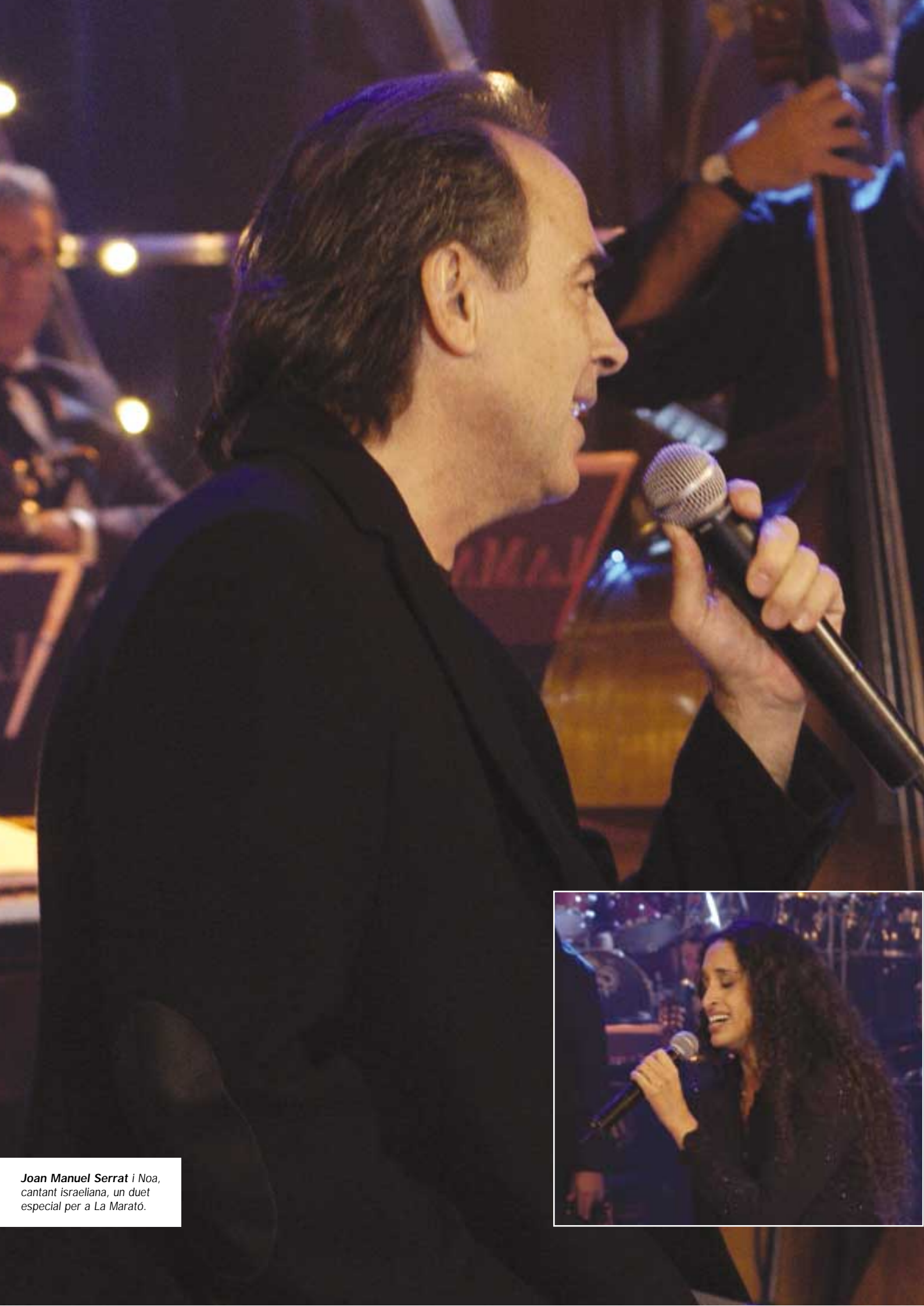
Joan Manuel Serrat i Noa, cantant israeliana, un duet especial per a La Marató.