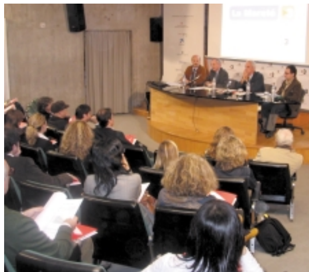
Presentació de la campanya de sensibilització i difusió de La Marató 2005 als mitjans de comunicació.

dors, informació sobre el Simposium científic, etc. Durant el període d'aquesta Memòria, la Fundació i CCRTVInteractiva van acordar dissenyar el nou web de la Fundació que permetés ampliar-ne els continguts i fer-la més dinàmica per a l'usuari.