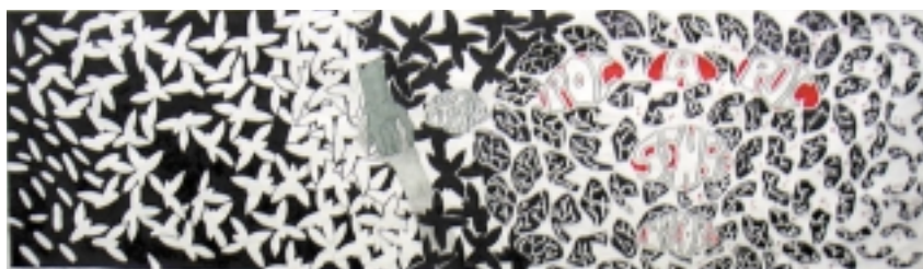
Mural guanyador de la setena edició del concurs Pinta La Marató

El premi va consistir en un cap de setmana a l'alberg de Castelló d'Empúries de la Xarxa d'Albergs de la Generalitat, per a tots els alumnes de la classe guanyadora, finançat pel Departament de Benestar i Família.